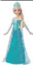
2015 Princesa Elsa de Frozen