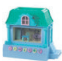
2007 La Casa Pixel Chix

Més d'un 70% dels pares asseguren que acaben alterant la carta dels fills als Reis