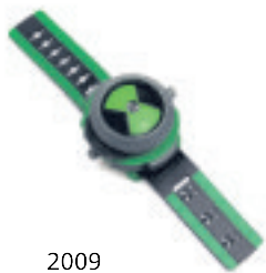
2009 Relotge Omnitrix