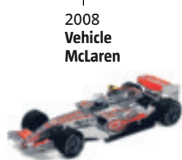
2008 Vehicle McLaren