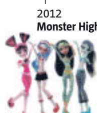
2012 Monster High