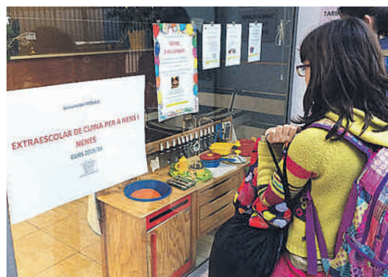
EL MOSAIC, A GRÀCIA, OFEREIX UNA EXTRAESCOLAR DE CUINA PER A NENS I NENES. G.M.

promís ètic. Les accions que es porten a terme busquen donar informació i prevenir casos d'assetjament tradicional i de ciberassetjament. Segons l'informe "Nuevas dimensiones de la convivencia escolar y juvenil. Ciberconducta y relaciones en la red: Ciberconvivencia", dirigit per Rosario Ortega de la Universitat de Còrdova, el 10% de joves pateix violència dins la relació de festeig i, a l'Estat espanyol, un 4% d'escolars declara patir un assetjament sever a través de les TIC, i un 20% de forma moderada o ocasional. La majoria de les víctimes són noies